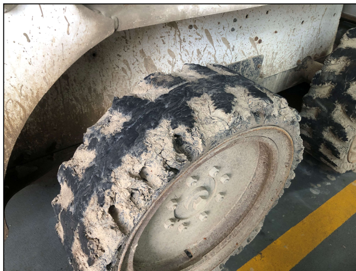
圖(二) 更換4顆實心胎(30X10-R16)