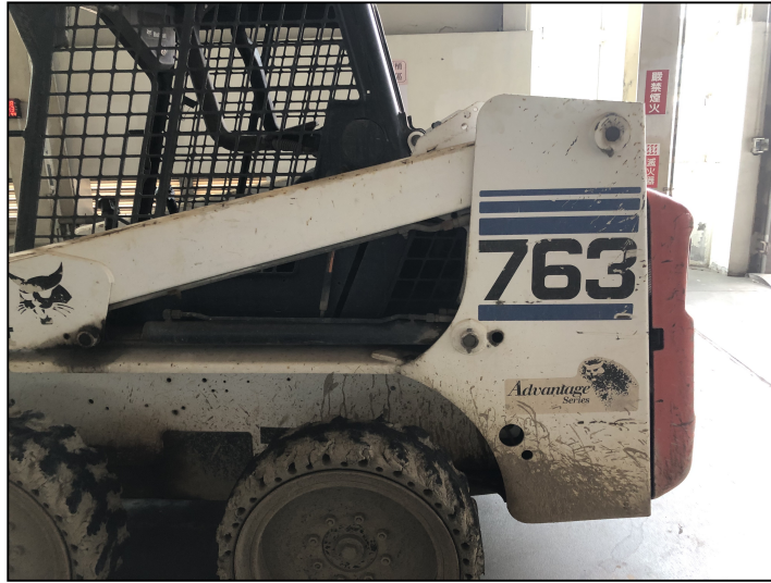
圖(一) 本機關鏟裝機 Bobcat763型（財產編號：3080201-11-0001）